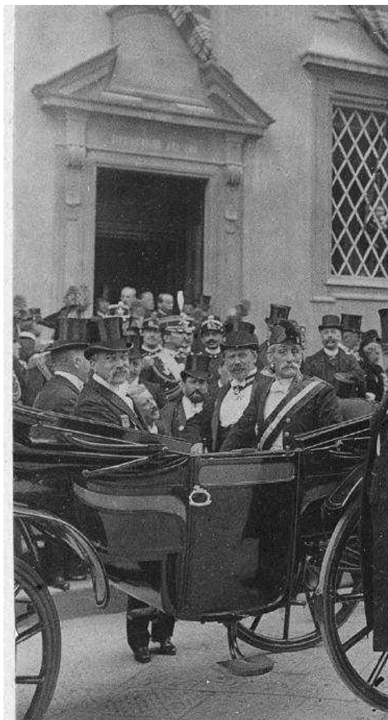
Immagine corrispondente all'unità I.9.1-007