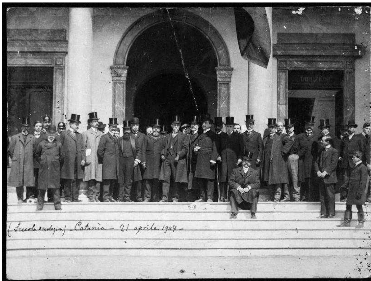
Immagine corrispondente all'unità I.9.1-006