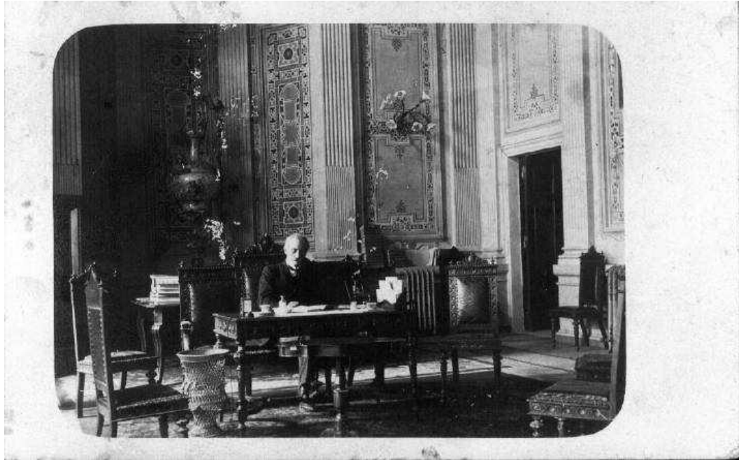
Immagine corrispondente all'unità I.9.2-03