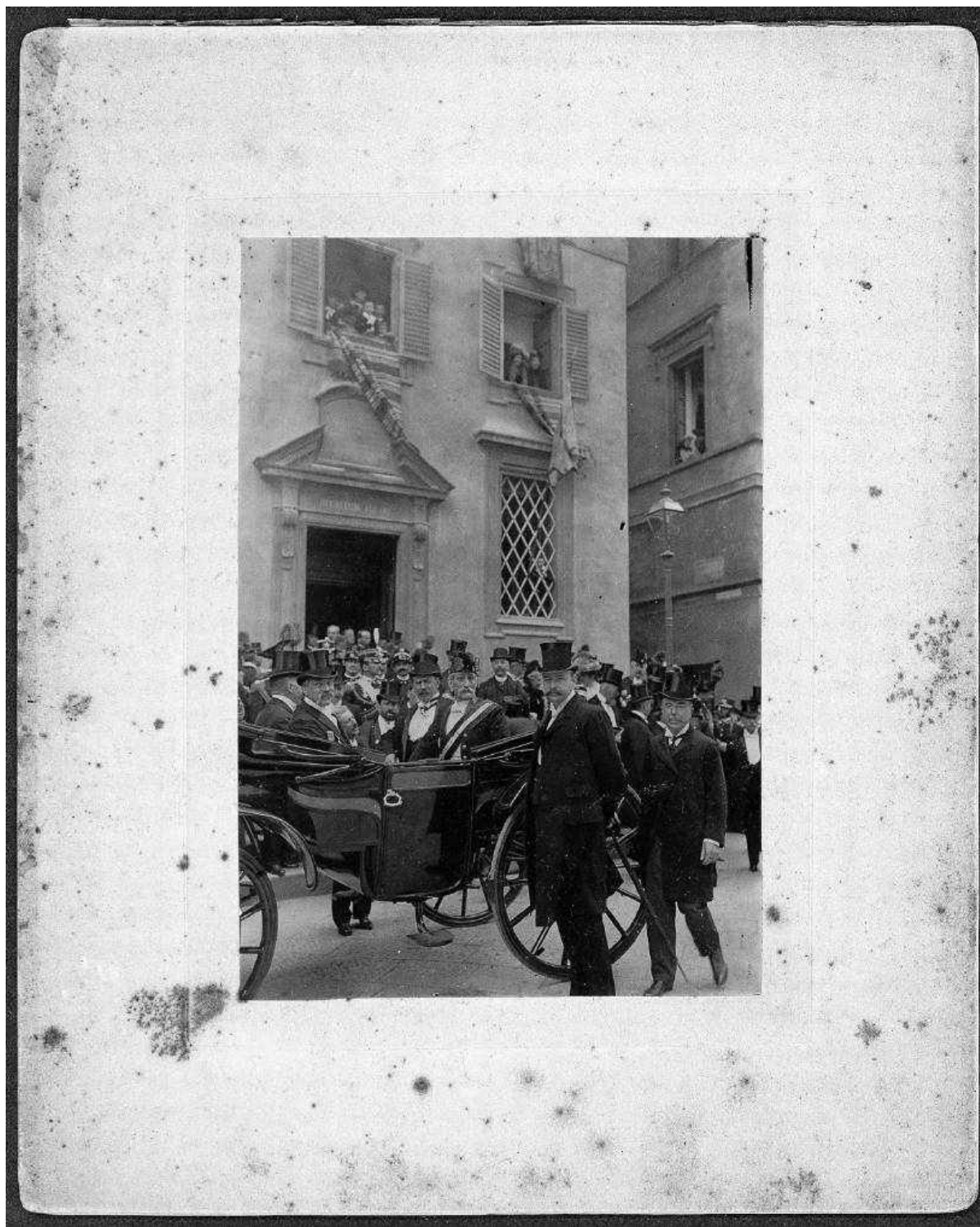
Immagine corrispondente all'unità I.9.1-003